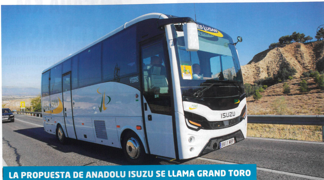
LA PROPUESTA DE ANADOLU ISUZU SE LLAMA GRAND TORO