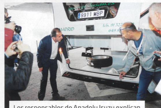
Los responsables de Anadolu Isuzu explican al Jurado las características del vehículo.