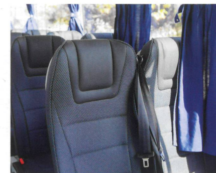
La unidad probada tenía capacidad para 34 pasajeros sentados.

El Grand Toro de Isuzu es el modelo que a simple vista nos sitúa ante un minibus en el pleno sentido, ya que conserva el estilo que todos tenemos en nuestra mente cuando oímos la palabra autobús o autocar. Su planteamiento de ser un vehículo con un precio económico, donde su objetivo es el transporte escolar y los recorridos de no más de dos o tres horas de duración, así como su maniobrabilidad, le dan el plus de poder llegar casi a cualquier sitio. Su mecánica robusta y su sencillez le otorgan una baza importante en el mercado, sobre todo porque las posibilidades de configuración a la hora de su manejo son, digamos, las justas y necesarias. Hoy en día, con la escasez de conductores y la falta de profesionalidad que estamos atravesando, un vehículo de estas características es perfecto porque todos sabemos que la tendencia es "tocar a ver qué pasa" o "tocar a ver para qué vale" y muchas veces se introducen configuraciones que no son óptimas para un funcionamiento eficiente. Este vehículo está hecho "para durar".